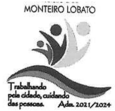
EDMAR JOSÉ DE ARAÚJO Prefeito Municipal de Monteiro Lobato